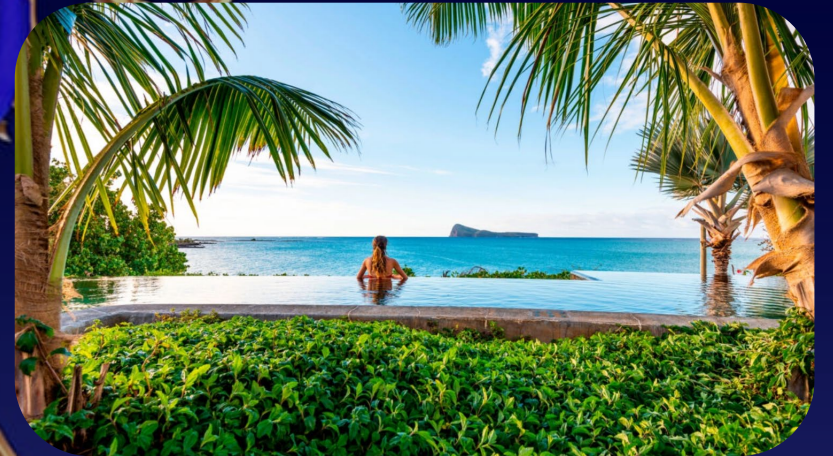
Urlaub im Wellnessparadies